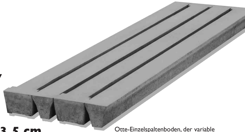
Otte-Einzelspaltenboden, der variable Boden für alle Anforderungen.